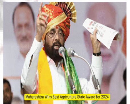
Maharashtra Wins Best Agriculture State Award for 2024

(A) हाल ही में महाराष्ट्र को कृषि और ग्रामीण समृद्धि के लिए नई नीतियां अपनाने और विकासात्मक पहलों के लिए वर्ष 2024 के सर्वश्रेष्ठ कृषि राज्य पुरस्कार के लिए चुना गया है। इस आशय की घोषणा 15वीं कृषि नेतृत्व पुरस्कार समिति द्वारा की गई जिसके अध्यक्ष भारत के पूर्व मुख्य न्यायाधीश और केरल के राज्यपाल न्यायमूर्ति पी सदाशिवम हैं।